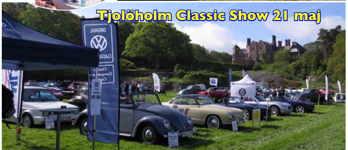
Tjolöholm Classic Show 21 maj