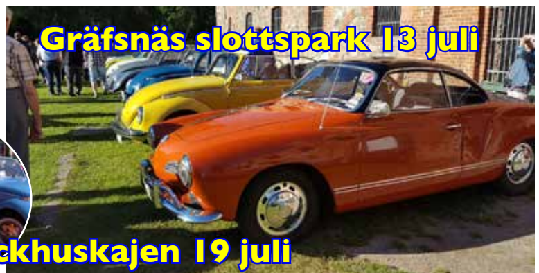
Gräfsnäs slottspark 13 juli