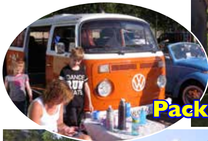
Packhuskajen 19 juli